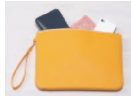
・Bag in bag・